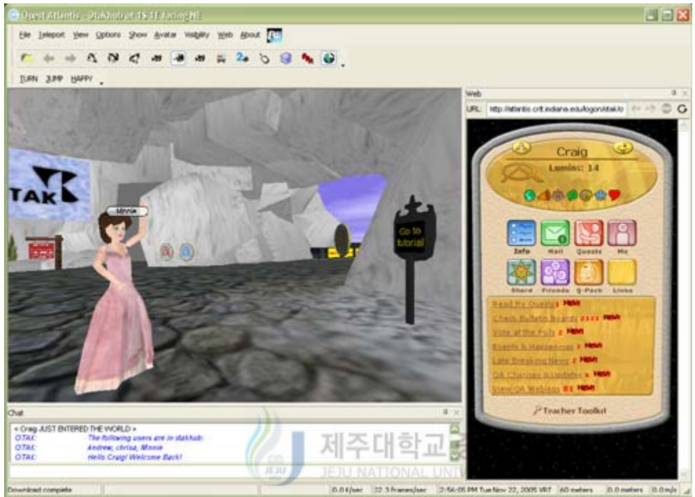
<그림 3> Quest Atlantis 프로젝트

In Quest Atlantis the central activity is to go "QUESTING!" Members do this by travelling through virtual villages and worlds in which they locate and complete quests. These quests create opportunities for members to learn and grow in a variety of fun and exciting ways, at the same time providing useful information for the citizens of Atlantis. Above is a screenshot from the 3-D version of Quest Atlantis showing a scene from a village (which is contained inside the World) on the left and the homepage for the Quester on the right.