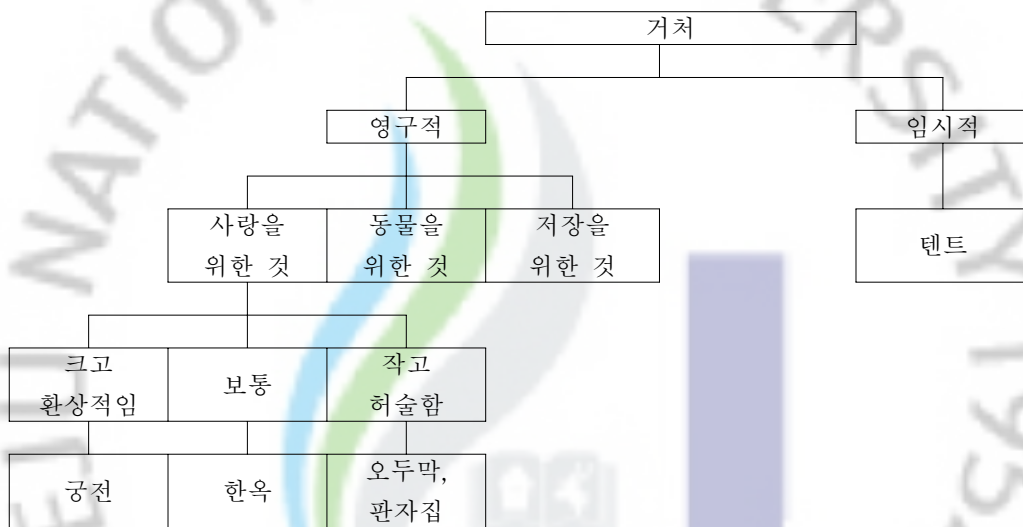
[그림 II-2] 거처에 대한 의미구조도

'의미 구조도 그리기'는 지도 대상이 되는 낱말과 다른 낱말과의 개념상의 차이점과 유사점을 도식화하여 그 어휘의 의미와 용법을 익히는 방법이다. 의미가 유사한 몇몇 단어들의 의미 변별을 통하여 의미를 정확히 알 수 있게 한다. 위계 구조에 따라 도식화할 수도 있고 순차 구조로 할 수도 있다. 또는 원이나 그래프 등의 형태로 제시할 수 있다. 그 개념을 의미에 따라 동일 구조나 위계 구조 등으로 구조적으로 제시한다는 점에서 의미 지도 그리기와는 차이가 있다.