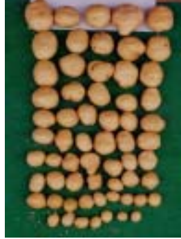
perlite + peatmoss