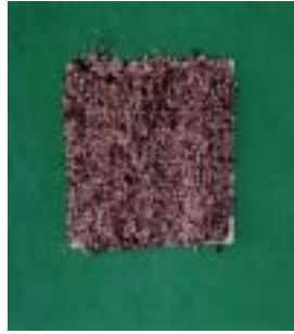
perlite + peatmoss