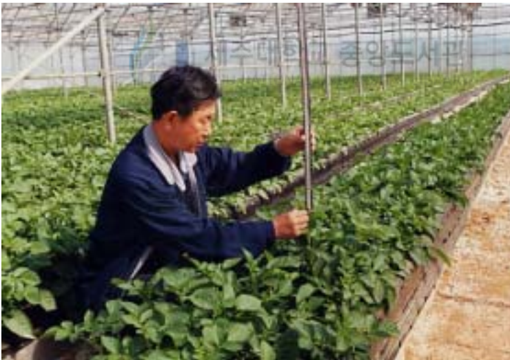
그림 2. 포장전경(정식후 40일)