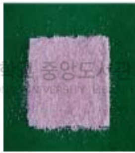
perlite + EPS