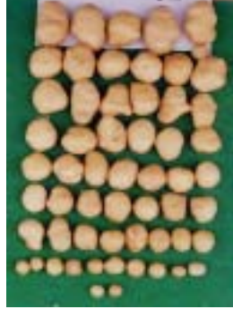
perlite + 상토