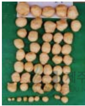
perlite + vermiculite