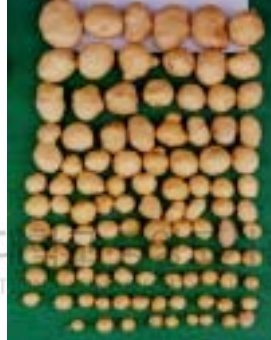
perlite + EPS