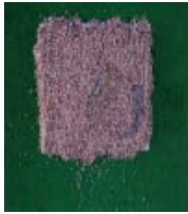
perlite + vermiculite