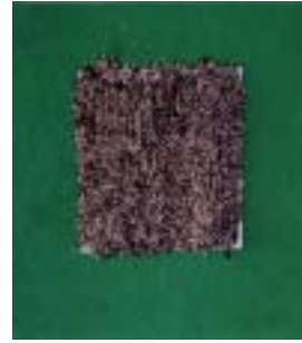
perlite + 상토