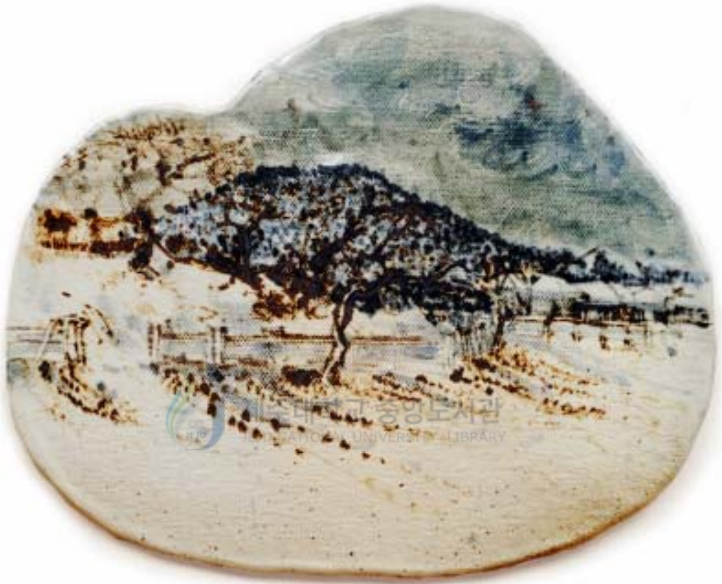
작 품 6 . 겨울소리 . 23 × 21cm