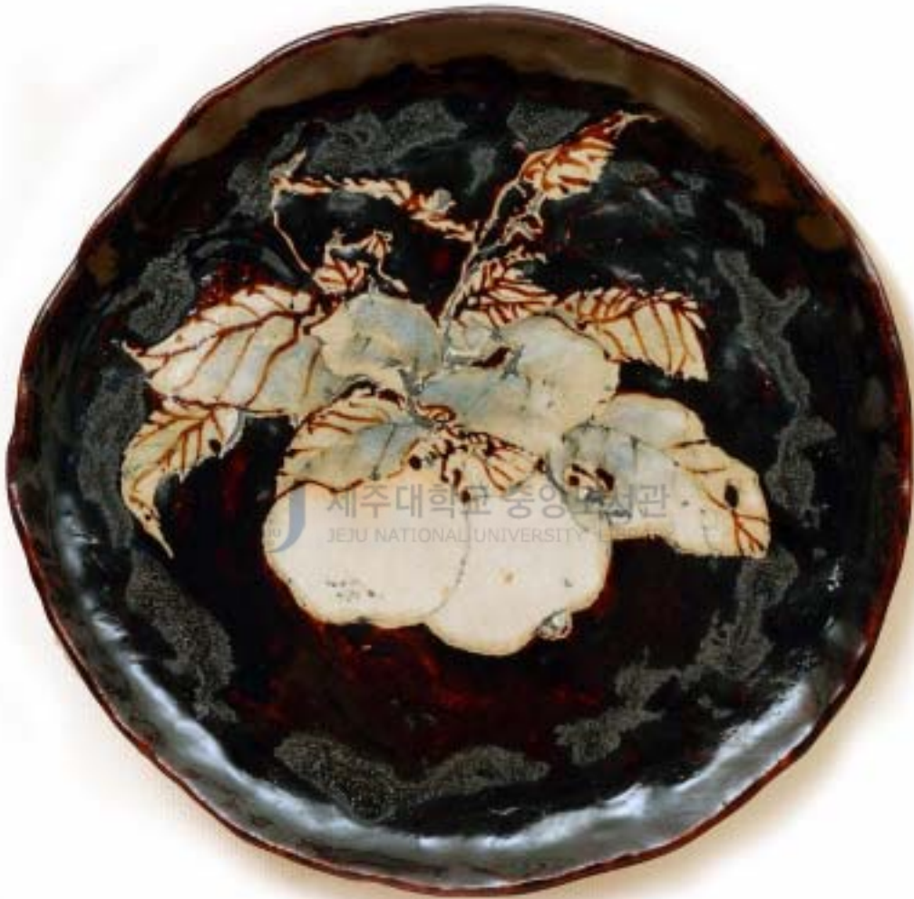
작 품 1 . 바 람 I . 17×17cm