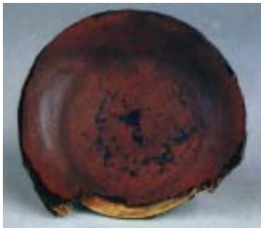
<도-3><朱漆대접> (雁鴨池) 통일신라