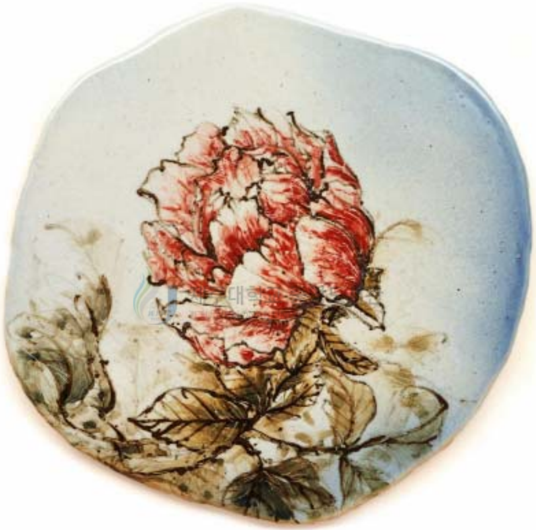
작 품 3 . 牡丹의 향기 . 21 × 22cm