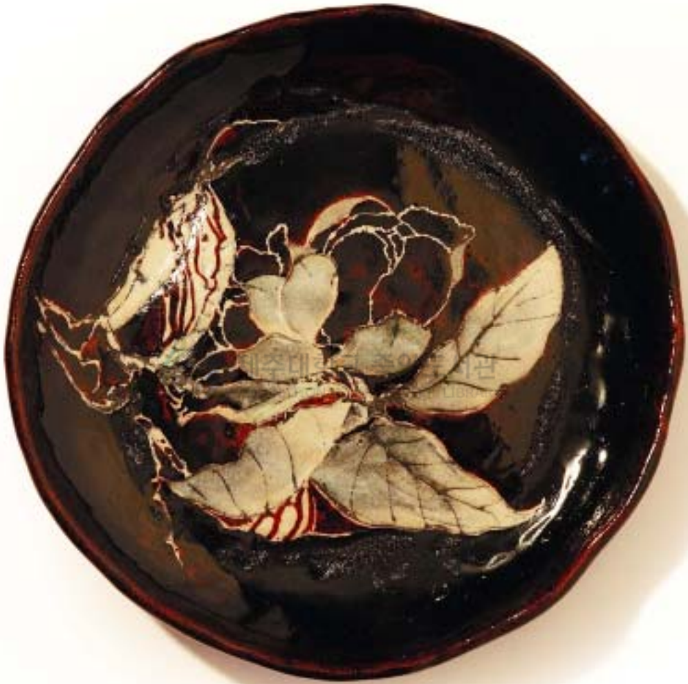
작 품 2 . 바 람Ⅱ . 16 × 16cm