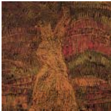
양도서관 <도-15><육망Ⅱ, 전용복>