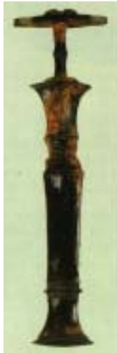
<도-1> <최초동검> (茶戶里 출토)기원전1세기