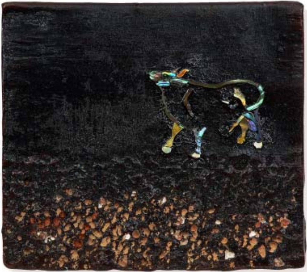
작 품 7 . 들녘 . 23 × 22cm