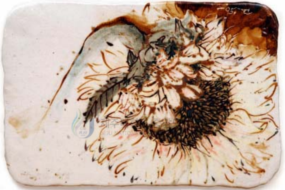
작 품 4 . 여름 향기 . 23 × 17cm