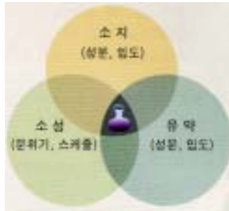
<도-18> 유약에 영향을 미치는 인자

금속산화물과 안료는 소성과정에서 다양한 색채로 변모된다. 그 중에서도 산화철의 색상 변화는 매우 매력적이다. 이는 함유량에 따라 옅은 크림색에서 짙은 갈색에 이르기까지 발색할 수 있으며, 산화염소성이나 환원염소성이나에 따라 그 색상표현이 더욱 다양해지기 때문이다. 산화철은 유약에 있어서 매우 활성이 강한 용제로 작용하여 조금만 넣어도 소성온도를 낮추게 된다. 그래서 조금 두껍게 바르거나 시유하면 흐르기도 하고 붉은 감색으로 아름답게 피어나기도 한다.