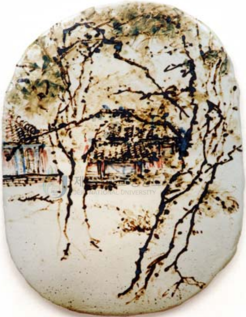
작 품 5 . 향기가 숨 쉬는 곳 (남국사) . 17 × 21cm