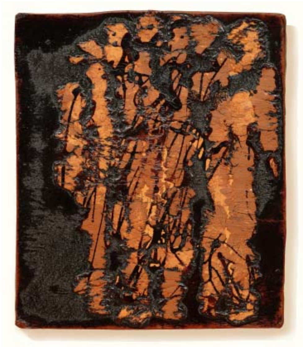
작 품 8 . 군중 . 23 × 22cm