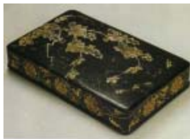
<도-7><捕盜蝶螺鈿衣裳箱>