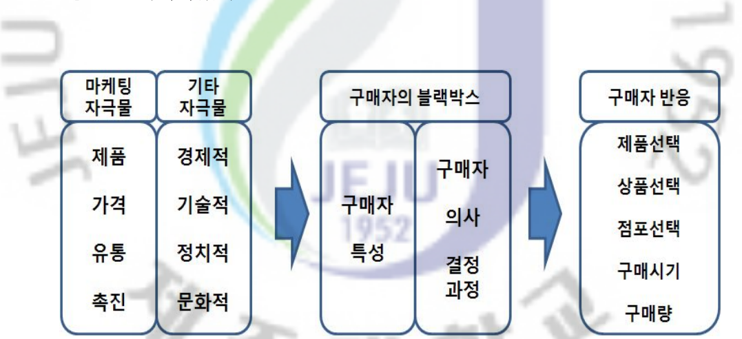
출처 : 천광석(2004), 소비자 점포선택행동에 관한 연구, 전주대학교 대학원, 박사학위논문, p.35. 재인용.

여운승(1995)<sup>52)</sup>은 기존의 소비자행동모형을 단순화하여 다음의 [그림 2-1]과 같은 모형으로 제시하였다.