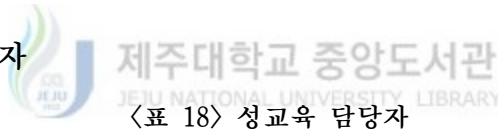
〈표 18〉 성교육 담당자