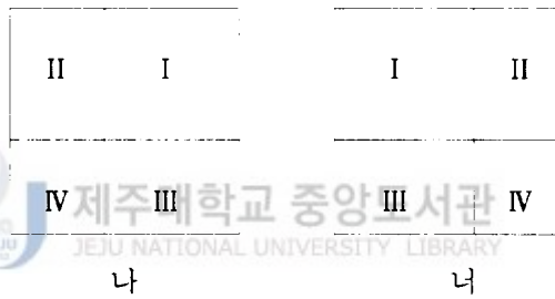
<그림 II-2> 만남의 관계

<그림 II-2>는 만남의 관계를 나타내고, <그림 II-3>은 스침의 관계를 나타낸다.