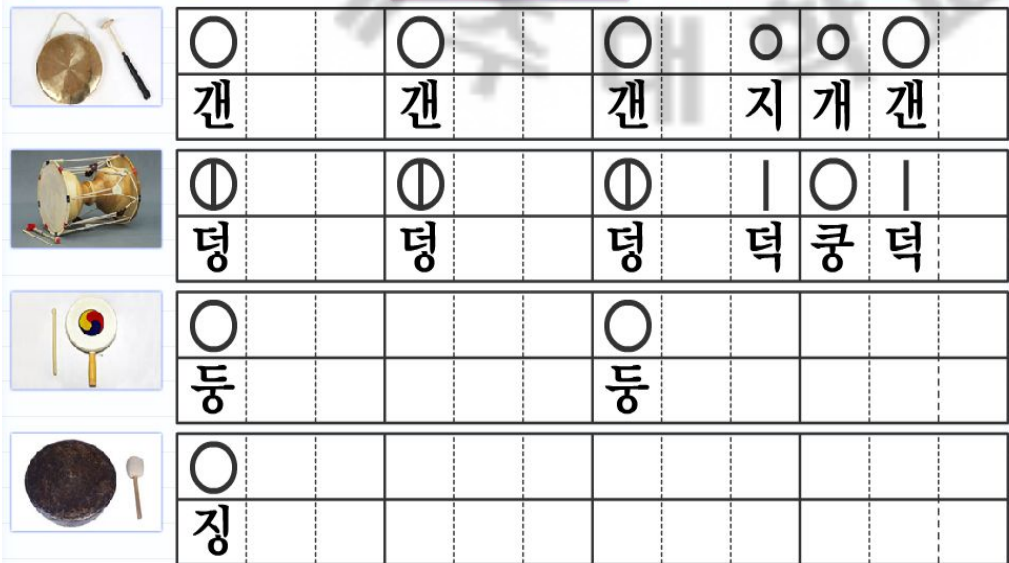
[그림 Ⅲ-13-삼채장단 정간보 2] 주. 출처 http://www.i-scream.com .