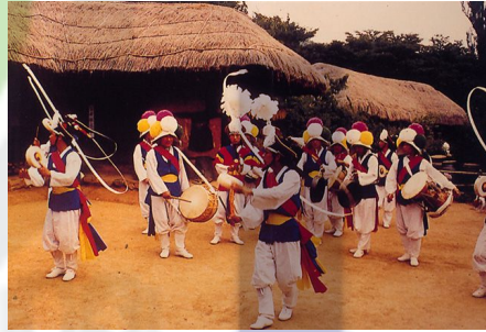
[그림 Ⅲ-4-풍물놀이 하는 모습]

풍물이란 굿, 두레, 풍장, 매구(매굿) 등의 여러 명칭으로 불린다. 농사일을 할 때 일의 고단함을 잊고 흥을 돋우기 위해 쟁과리, 장구, 북, 징, 소고, 태평소, 나발 등의 악기를 연주하며 춤을 추거나 놀이를 베푸는 총체적인 연희 형태를 말한다.