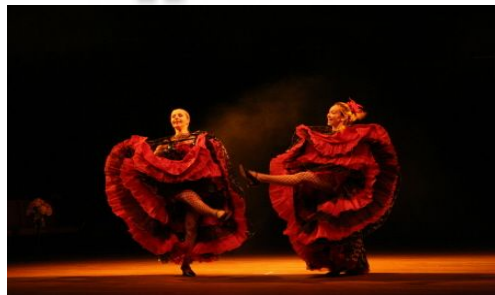
[그림 III-3-칸칸 춤추는 모습]

샤위(chahut)라고도 한다. 처음에는 다리를 높이 차올리는 것이 특징인 서민적인 춤이었으나, 1845년경부터 카지노나 뮤직홀의 쇼로 등장하여 플랑루주의 근거로 파리의 명물이 되었다. 주름을 많이 잡은 치마를 들어 올리고 검은색 긴 양말을 신은 다리를 높이 차올리며 추는 빠른 템포의 춤이다.