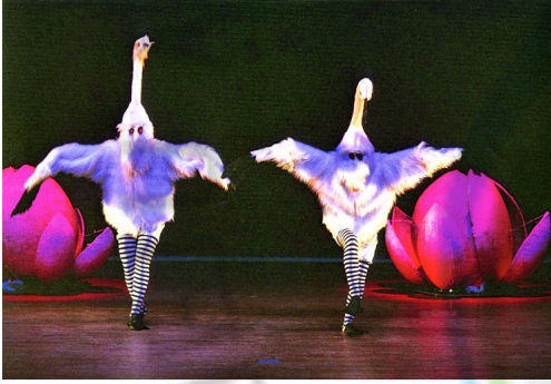
[그림 III-22-학무 사진1]