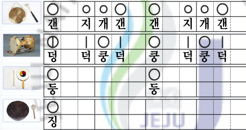
[그림 Ⅲ-12-삼채장단 정간보1] 주. 출처 http://www.i-scream.com .