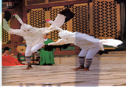
[그림 III-23-학무 사진2]