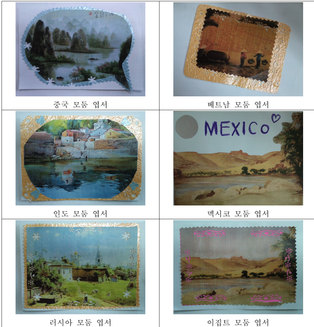
[그림 Ⅲ-8] 풍경화 엽서 만들기 학습 결과물