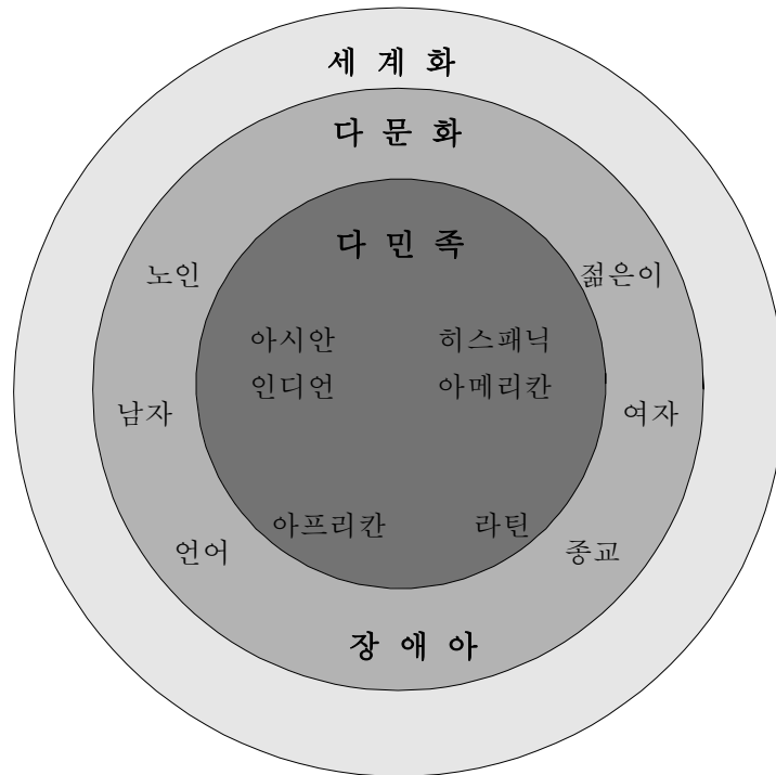
<표 II-1> Baker의 다민족, 다문화, 세계화 교육(장영희, 1997, p.299)

<표 II-1>에서 보면 다민족 교육은 다문화 교육에 포함되고 세계화 교육은 다민족 교육과 다문화 교육을 모두 포함하고 있다. 다민족 교육은 1960년대 소수민족의 권리와 가치를 존중하며, 이러한 정신을 공교육에 반영하기 위하여 법(The Civil Right of 1964)을 제정하면서 사용되기 시작하였다. 다문화 교육은 문화적 다양성을 가치 있는 자원으로 여기며 이를 지원하고 확장하려는 교육이다. 즉, 다른 문화를 단순히 인정해 주는 것이 아닌 다양성이야말로 앞으로 세계에서 가장 중요한 요소라는 인식의 변화를 의미한다. 더 나아가 다문화 교육은 개인차는 물론 인종, 민족, 종교, 성별, 사회, 경제적 수준, 연령, 능력, 신체적 조건 등의 다양성까지 모두 포함하는 보다 넓은 범주의 개념으로 확장되어 사용되고 있다.