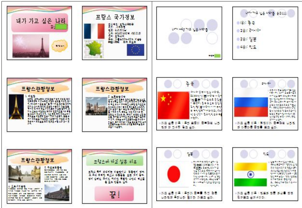
[그림 III-34] 내가 가고 싶은 나라 조사하기 학습 결과물