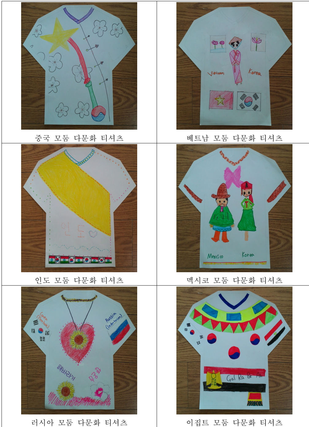
[그림 III-16] 다문화 티셔츠 만들기 학습 결과물