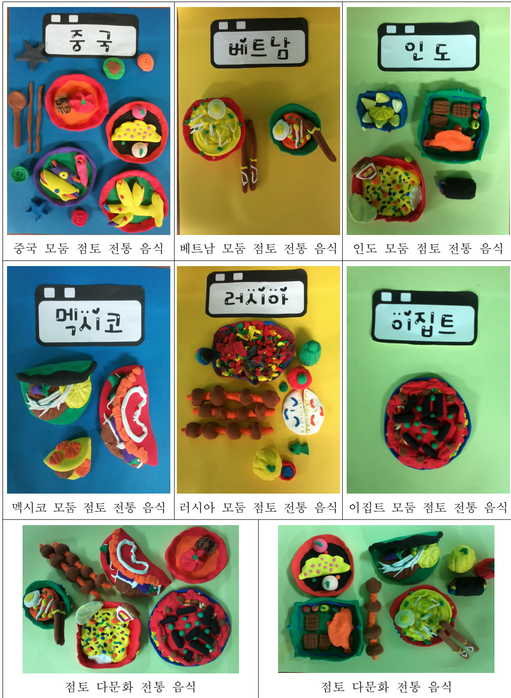
[그림 Ⅲ-24] 점토 다문화 전통 음식 만들기 학습 결과물