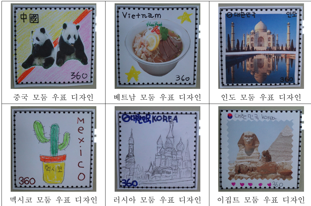
[그림 III-32] 우표 디자인 학습 결과물