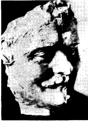
도13) 웃는 Balzac -teracotta.