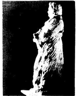
도15) 실내복차림의 Balzac.