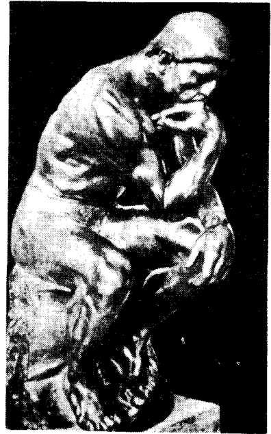
도2) The Thinker. Bronze. 1904