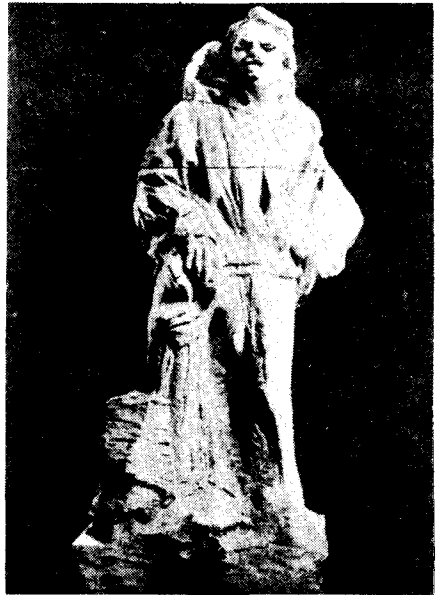
도12) 실내복 차림의 Balzac.