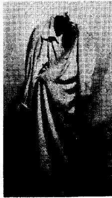
도14) 가운 - 석고