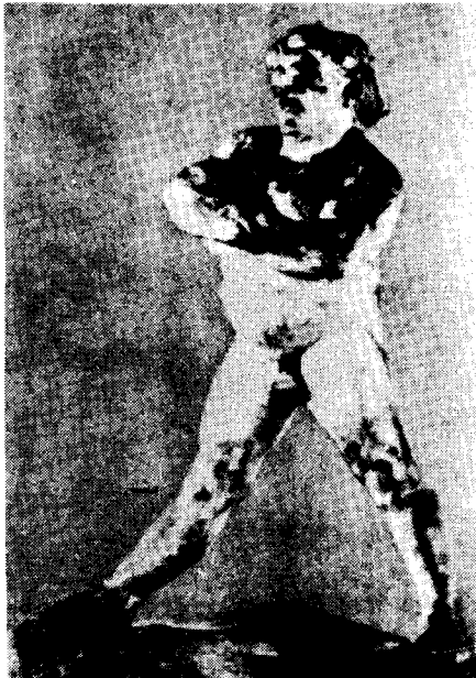
도11) 다리를 벌리고 서있는 Balzac의 누드습작.