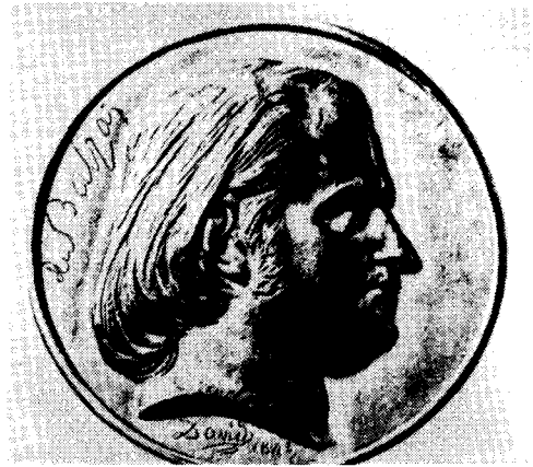
도17) Balzac상(메달) David Angers - 1842.