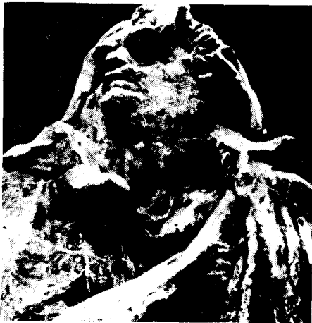
도7) 완성된 Balzac 상의 상단부분.