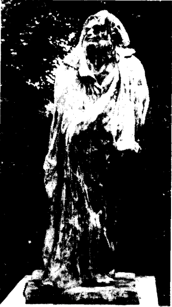
도5) 완성된 Balzac. 정면