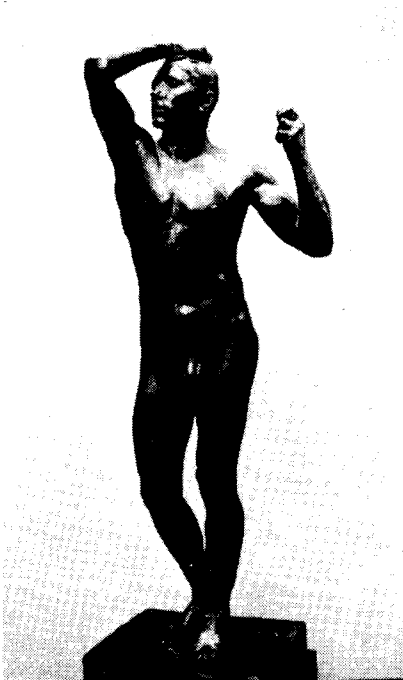
도3) 청동시대. Bronze. 1877.