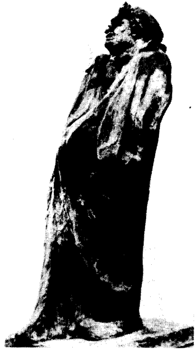
도10) 완성된 Balzac상의 측면.