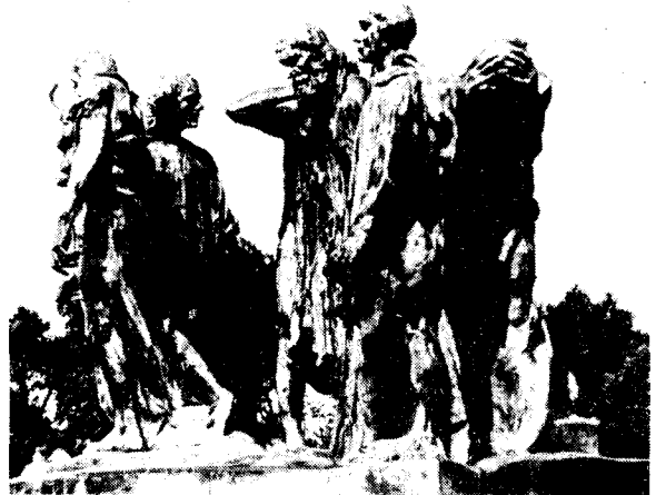
도19) 카레의 시민, 1884.