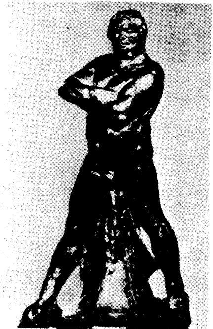
도8) Balzac의 누드