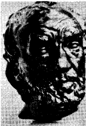
도18) 코가 부러진 남자, 1864.