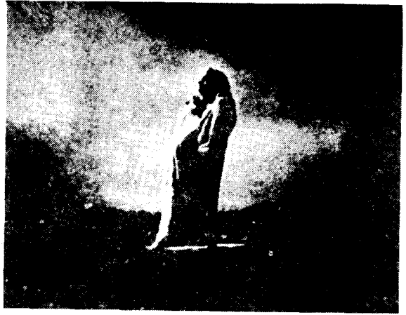
도6) Meudon의 Balzac상.