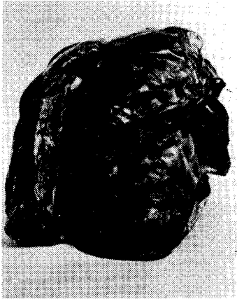
도16) Balzac의 두상.