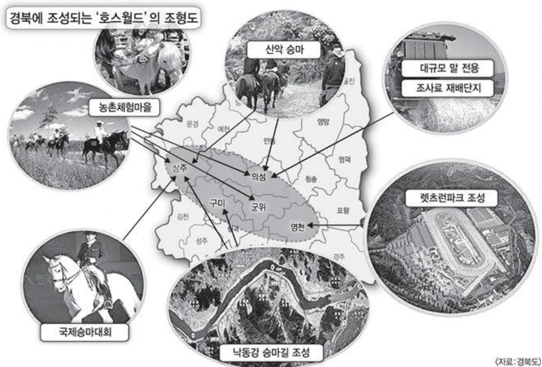
<그림 3> 경북 호스월드의 말산업 육성 계획 조형도 27)

경상북도의 말산업 육성 계획은 2015년부터 2019년까지 1천180억원을 투자하여 낙동강 승마길 조성, 렛츠런파크 영천과 연계한 경주마 휴양시설과 승용마 거점 조련시설 운영, 말 관련 상설공연장 설치, 농촌 승마체험마을 조성, 임도(林道)를 이용한 산악트레킹 코스 개발, 말 전용 조사료 재배단지 조성, 전문인력 양성기관의 육성, 국립 재할승마센터 설치 등의 사업을 진행하여 5개 시·군(구미·영천·상주·군위·의성)에 호스월드(Horse World)를 구축하는 것이다. <그림 3> 참고.