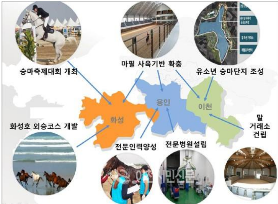
<그림 4> 경기 호스랜드의 말산업 육성 계획 조형도 28)

이어서 경기도의 말산업 특구인 3개 시(용인·화성·이천)의 말산업 육성 정책을 자세히 살펴보면, 용인시에서는 산악승마길 조성, 축산농가 말 사육 전환 지원, 승용마 구입 지원, 말 6차 산업화 체험농장 조성, 재활승마 전문 승마장 육성 지원, 말 전용 운송 차량 구입 지원, 말 조련 장비 지원, 외승코스 조성, 축제와 연계한 승마 체험 행사, 유소년 승마단 창단 지원, 외승 프로그램 참여자 기승료 지원 등의 사업에 5,036백만원을 투자하여 말 생산 육성 기반을 구축하고, 농촌관광 승마를 활성화하여 말 산업 경쟁력을 강화하고 있다.