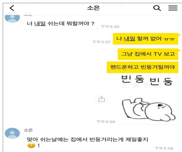
<그림 2> 카카오톡 이모티콘에서 쓰이는 의성어·의태어 예시

다음과 같은 카카오톡 예시 자료를 통해 카카오톡 활용 지도안의 효과를 확인해볼 수 있다.