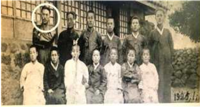
<그림2> 新成私塾 1회 졸업기념 사진 (1925.1) 95)

한 후 1920년 이후에 운영한 조천독립(독서)회관 96) 에서 강사로 활동했다. 97) 이 회관은 3·1운동을 주도한 인물들이 중심이 되어 운영한 곳으로, 3·1운동 이후 민족항일의식으로 고양된 청소년들이 공부하며 학술연구에 힘썼다. 98)