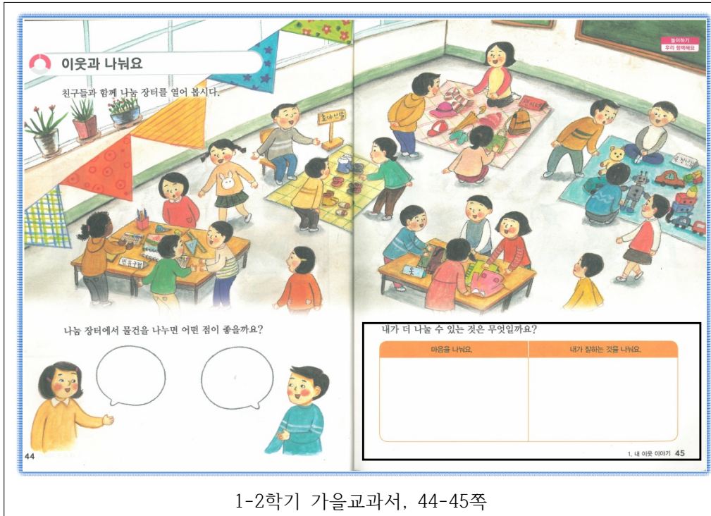
1-2학기 가을교과서, 44-45쪽

나눔 장터를 열면서 ‘내가 더 나눌 수 있는 것은 무엇일까요?’라는 질문에 마음을 나눴어요/내가 잘하는 것을 나눴어요 칸으로 글쓰기 칸이 나뉘어져 있는데 마음을 나눴어요 칸에 어떤 내용을 써야할지 그 기준이 모호한 글쓰기 활동도 나타나고 있다. 이런 글쓰기 활동은 1학년 학생에게는 더욱 어려운 과제 제시가 된다. 문장이나 단어를 쓰면서 글자에 대한 학생들의 질문이 이어지기도 하는데 쓰기 활동과제 자체가 이해가 되지 않았을 경우 학생들은 쓰기에 심적으로 더 어려움을 느끼게 된다.