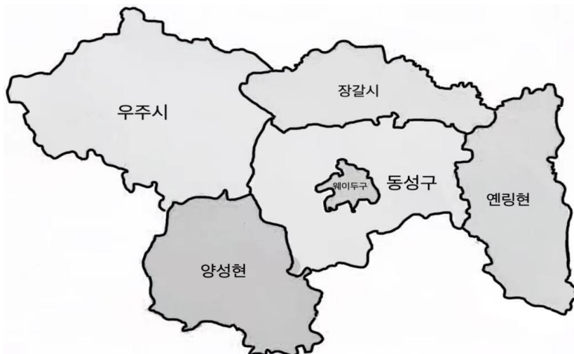
<그림 2-2> 쉬창시 행정구역