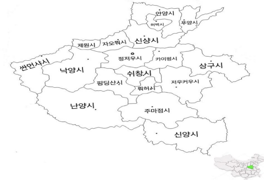
<그림 2-1> 허난성 쉬창시의 위치