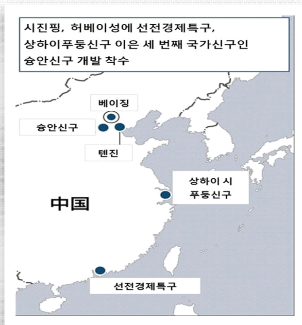
<그림 2> 숭안 신구의 지리위치

숭안신구는 숭현(雄縣), 룡청현(容城縣), 안신현(安新縣)의 세 현으로 구성되어 있으며 행정 면적은 약 1556 평방 킬로미터, 총 인구는 약 113 만 명, 장기 계획 수용 인구는 200 만~250 만 명, 인구 밀도는 평방킬로미터 당 1000 에서 1250 명 정도로 베이징시와 비슷한 인구 밀도로 계획되어 있다. 지역 총생산은 약 218.3 억 위안, 1 인당 총생산은 2 만 위안 미만으로 주변 도시와 여전히 큰 차이가 존재한다. 또한 3 현 간에도 현저한 격차가 존재한다. 안신현과 룡청현의 지역 총생산은 각각 57.8 억 위안과 59.4 억 위안으로 낮은 반면 숭 현의 지역 총생산은 2016 년에 101.1 억 위안에 달한다. 18) 전체적으로 숭안신구는 인구가 적고 도시화 수준이 낮으며 지역 발전이 끝난