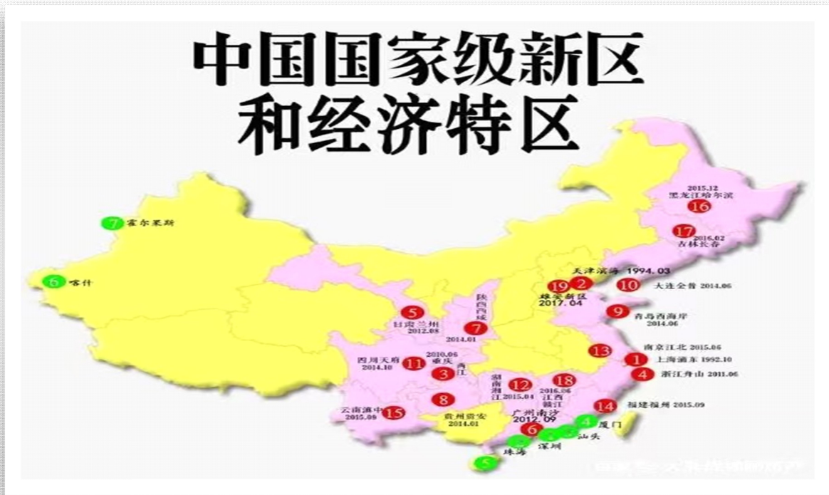
<그림 1> 중국국가급신구의 지리위치