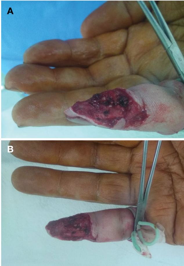
Figure 1. Preoperative injury site image (A: Right hand 5 th finger side view, B: Right hand 5 th finger palmar side view).

되었다(Fig. 1A and B). 절단된 부위는 발견하지 못한 상태였다. 과거력으로 내원 5개월 전 대장암 진단받아 내원 1달 전에 수술적 치료를 받았다. 5년 전 진단받은 심방세동으로 인해 약물을 복용 중이었다. 수술은 국소 마취 하에 진행되었고 먼저 상처부위의 죽은 조직들을 깨끗이 정리하였다. 노출된 뼈는 남아있는 수지 속질(finger pulp)로 덮어주었다. ADM을 이용하여 연부조직 위에 이식하였다(Fig. 2A and B). 이후 3개월간 경과관찰 하였으며 특히 합병증 없이 창상치유 되었다(Fig. 3A and B).