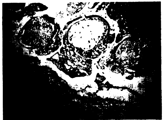
Figure 5. Histological section shows chorionic villi.