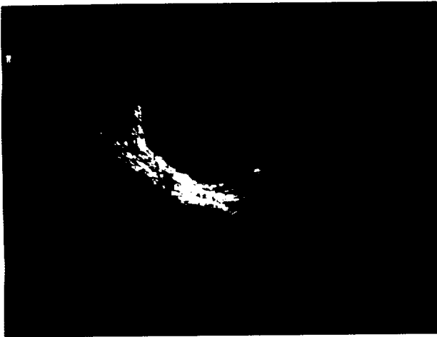
Figure 2. Abdominal gestational sac revealed during transvaginal ultrasound. The unusual location of the pregnancy was particularly evident in the dynamic modality of the ultrasonographic examination. The finding shows CRL is 1.95mm.