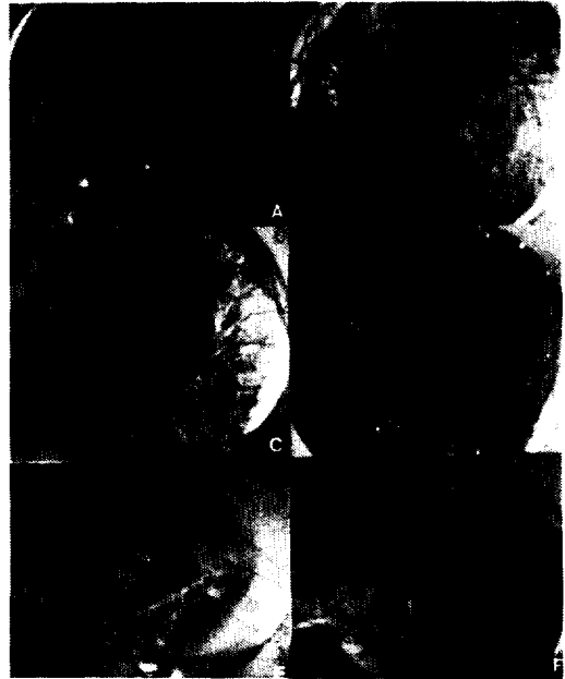
Fig. 3. culture of A. belladonna hairy roots in NN liquid medium added IBA

하였으며(Fig. 3). 또한 각 농도별(0.01, 0.1, 1, 10, 100mg/l)로 처리하여 10일 간격으로 성장량을 측정하였다.