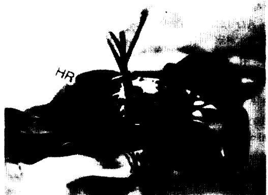
Fig. 1. Hairy root induced by A. rhizogenes strain R1000 HR: hairy roots

A. belladonna 의 모상근 유도는 표면살균된 종자를 25°C, 6,000lux, 16시간 조명하에서 3주간 배양하여 유식물체를 얻었고, 발아된 유식물에 YEB배지에서 3일간 배양한 A. rhizogenes strain R1000을 direct infection법으로 상처부위에 감염시켜 광조건하에서 배양하였다. 3-4주후 균을 접종한 상처부위에서 tumor조직이 형성되고 모상근이 유도되었다(Fig. 1).