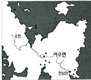
그림3. 여수면 소속 군정의 거주지

위의 <그림2·3>에 표기되어 있는 바와 같이, 순천부 군정의 거주지는 여수면(9리), 도리면(9리), 해촌면(19리), 별량면(29리) 등으로, 이들 군정의 거주지를 일제강점기에 제작된 지도에 표기해 놓은 것이다. 도면에서 원형표시는 군정의 거주지인 리의 입지를 표기한 것이고, 실선은