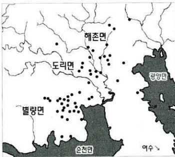
그림2. 해촌·도리·별량면 군정의 거주지

넷째, 19세기 순천부 군정의 거주지이다. 순천부 군정 680명을 리(촌)를 단위로 하여 지도에 표기하면 다음 <그림2·3>과 같다.